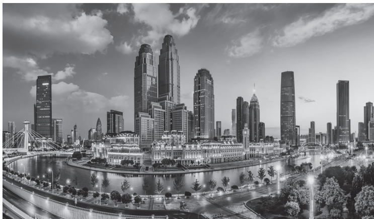
▲天津市和平区夜景

学习贯彻习近平文化思想是当前和今后一个时期宣传思想文化战线的重大政治任务，要在这样的政治定位中深学细悟、融会贯通，推动习近平文化思想的学习走深走实。一是要站在坚定拥护“两个确立”、坚决做到“两个维护”的政治高度来深刻领会和把握。习近平文化思想深刻回答了新时代我国文化强国建设举什么旗、走什么路、坚持什么原则、实现什么目的等根本问题，是习近平新时代中国特色社会主义思想的文化篇，要自觉在增强“四个意识”、坚定“四个自信”、做到“两个维护”的高度上加强对习近平文化思想的学习、研究和阐释。二是要站在“强国建设、民族复兴”的战略高度深刻领会和把握。党的二十大擘画了全面建设社会主义现代化国家、以中国式现代化全面推