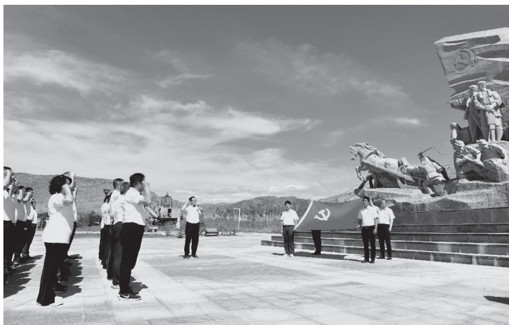
▲新疆有色集团党员干部重温入党誓词，重走可可托海之路，感悟初心使命

坚持把新时代思想政治工作融入理论武装，把准企业高质量发展之舵。一是紧跟核心强忠诚。集团党委中心组坚持读原著、学原文、悟原理、知原义，紧密联系思想和工作实际，深入学习习近平总书记重要著作，跟进学习习近平总书记最新重要讲话精神，特别是习近平总书记在2022年7月12