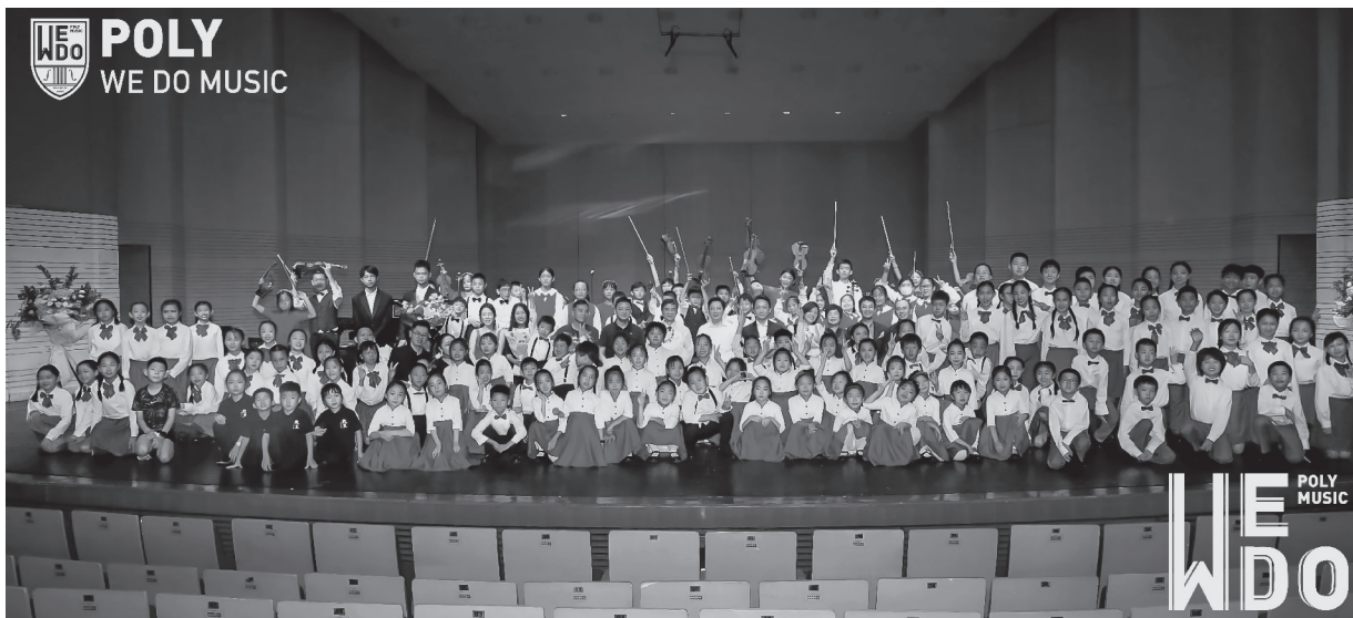
▲保利WeDo童声合唱团赴国外参加国际合唱节比赛

习近平总书记对宣传思想文化工作作出重要指示强调，要强化政治担当，勇于改革创新，敢于善于斗争，不断开创新时代宣传思想文化工作新局面。中国保利集团有限公司（以下简称“保利集团”）作为唯一以文化艺术经营为主业的中央企业，牢牢把握宣传思想文化工作对党和国家事业全局的极端重要性，在深刻领会习近平文化思想中把握稳发展航向，在繁荣壮大文化产业中争当产业链“链长”，在担当新时代新的文化使命下勇于示范表率，守正创新、汇聚力量，为建设社会主义文化强国作出新的贡献。