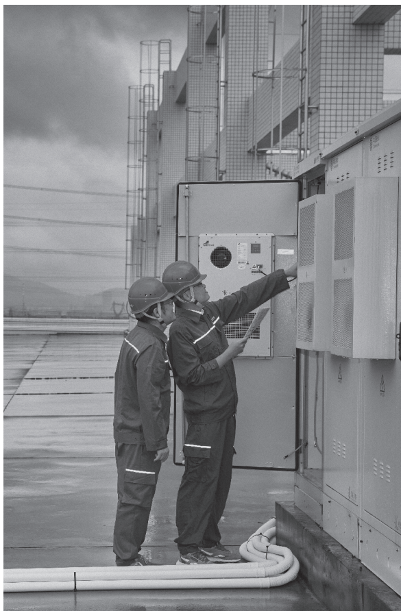
▲党员带头进行重大项目攻坚

教育学认知理论认为，教育过程中的学习和思维活动是基于内部认知的变化，而非只是受到外部刺激的被动反应。它要求教育要适应学习者的认知水平，引导并促进学习者的认知发展。近年来，广州供电局通信中心针对职工自主意识不断增强、不轻信不盲从的新特点，以及企业存在的理论学习内容、方法单一等问题，运用教育学认知理论，探索创新出一套行之有效的理论学习策略与模式，使党的理论知识故事化、形象化、生活化，实现政治话语和大众话语的有机统一。一是专题研讨，通过“沙龙会谈”让党的创新理论入脑入心。充分利用“党员活动室”“职工之家”“青马小组”“政研课题小组”等阵地和平台，采取党员领导干部带头示范的形式，结合主题党日、班前班后会、安全学习等，有计划有组织地开展党史与政治理论研讨活动。二是浸润感化，通过“群体情境”教育人陶冶人塑造人。把学习教育对象放到群众环境中进行。例如，以