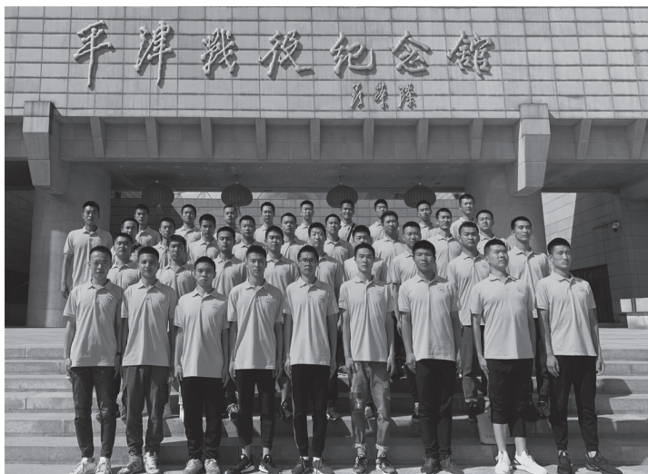
▲作者（第一排左三）参观平津战役纪念馆

经过三年半军事化的学校生活，我顺利地进入军营，成为一名合格的士兵，圆了儿时的梦想。进入部队后，身份也由此转变，从学生到军人，是一个华丽的转身。在五年军事生涯中，我明白了许多事情，成长了许多，收获了很多。第一要守纪律和担责任。军队要有纪律和责任，遵守纪律、承担责任和准时完成任务，让我更加有担当，能够为祖国贡献、为社会造福，为人民服务、为国防献身，同时也能被人民所尊敬。第二要加强团队合作。军队强调团队精神，集体利益大于个人利益，个体需要服从集体，才能使这个团体更加牢固。所以士兵们相互依赖、协作和支持。几年的当兵生涯，让我学会与不同背景和性格的人合作。第三要注重体能训练。通过参与晨跑、军事训练和体能测试，让每个士兵提高身体素质、增强耐力和力量，为建设世界一流军队提供前提保证。在军队中，时常会有突击检查，查看士兵们的状态，要做到随时拉得出、跑得快，只有这样才能打胜仗。第四要不断提升自我。参军的经历为我提供了自我提升的机会，不仅学习了理论知识，同时也加强了实践锻炼，提高了自己各方面的能力，如武器操作、战术训练、医