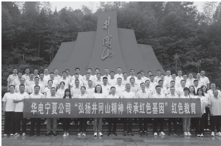
▲中国华电集团有限公司宁夏分公司开展红色教育

抓好思政工作的核心点，重点抓领导干部这一“关键少数”。公司党委突出加强领导干部思想作风和工作作风建设，切实把“软指标”变为“硬约